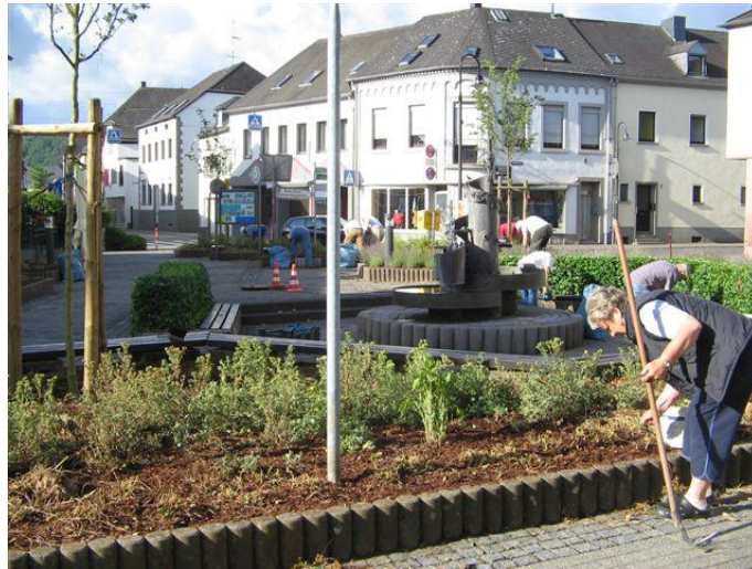
Raiffeisenbrunnen mit Begrünungsanlage

Als jüngste Maßnahme der Stadtverschönerung hat der HVV den Platz am Raiffeisenbrunnen neu gestaltet. An 30. Mai 2009 wurde der Platz feierlich im Rahmen des 25-jährigen Stadtjubiläums der Stadt als Geschenk übergeben. Seit dieser Zeit wird die Anlage regelmäßig von Mitgliedern gepflegt.