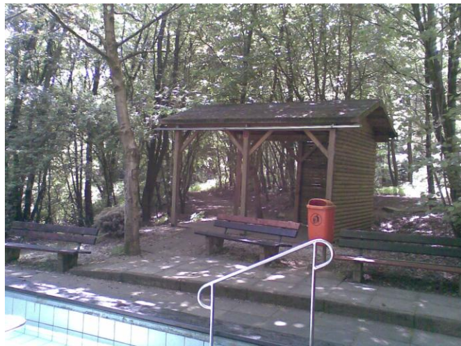
Wassertretbecken und Schutzhütte am Heilbrunnen

Die Ecke Bernhard Becker Strasse / Isseler Strasse wurde 2002, gemeinsam mit dem Jahrgang 1939, neu gestaltet. In der Mitte wurde ein 5 Tonnen Granitstein-Findling aus der Donau aufgestellt, den eine Schweicherin, die an der Donau bei Wallsee verheiratet ist, stiftete. Daher der Namen „Wallsee-Eck“.